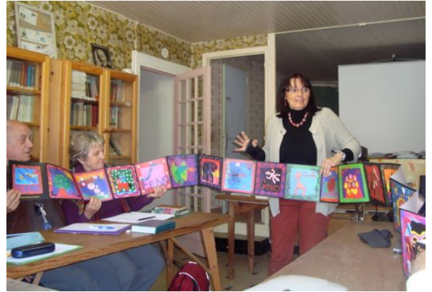
Demontrado de lernilo