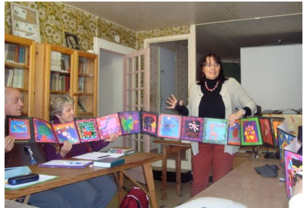
Demontrado de lernilo